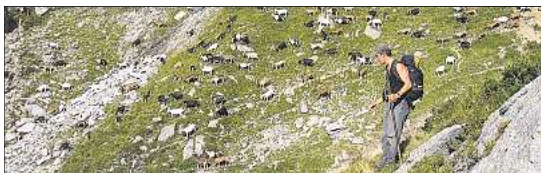
In di cun blera lavur sin l'alp da chauras

nas giuvnas pericolavan ellas il regiuvnament dal guaud. Characteristics eran ils 'pignets da chauras'. Ma las chauras rusignavan era vi da plantas pli grondas. Perquai han ins limità la pasculaziun libra u in summa scumandà d'utilisar las pastgiras en ils guauds.