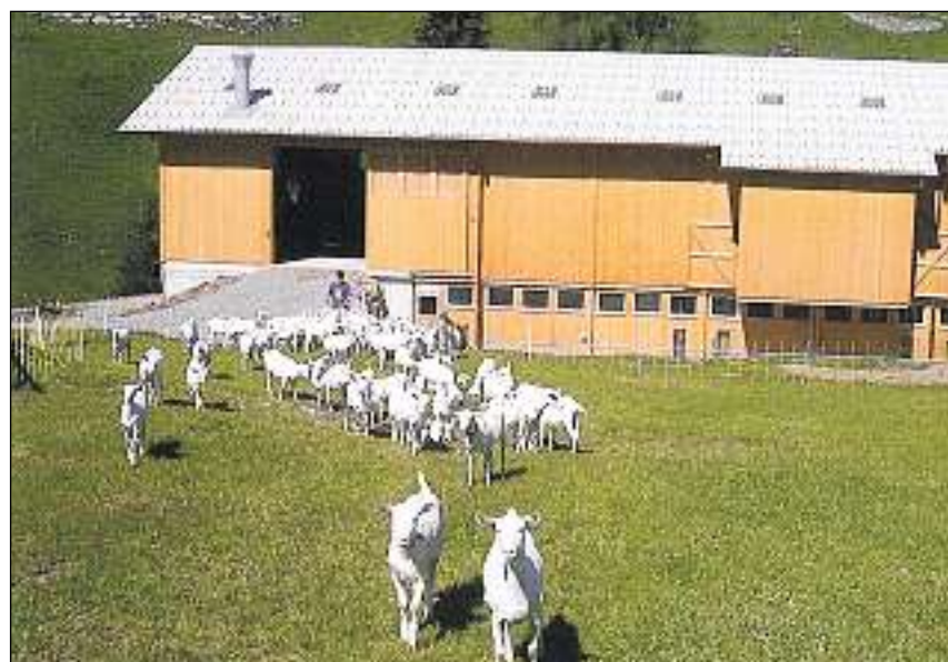
Il tegnair chauras dovra oz in spiert d'interprender

liunà il diavel cun in buc-chaura; en in'otra legenda defenda il buc-chaura sia muntanera e scurrenta il diavel. Er en paraulas e raquints sco 'Il luf ed ils set ansiels' dals frars Grimm e 'Zocla, Zila, Zepa' dad Alois Carigiet gogan las chauras ina rolla impurtanta.