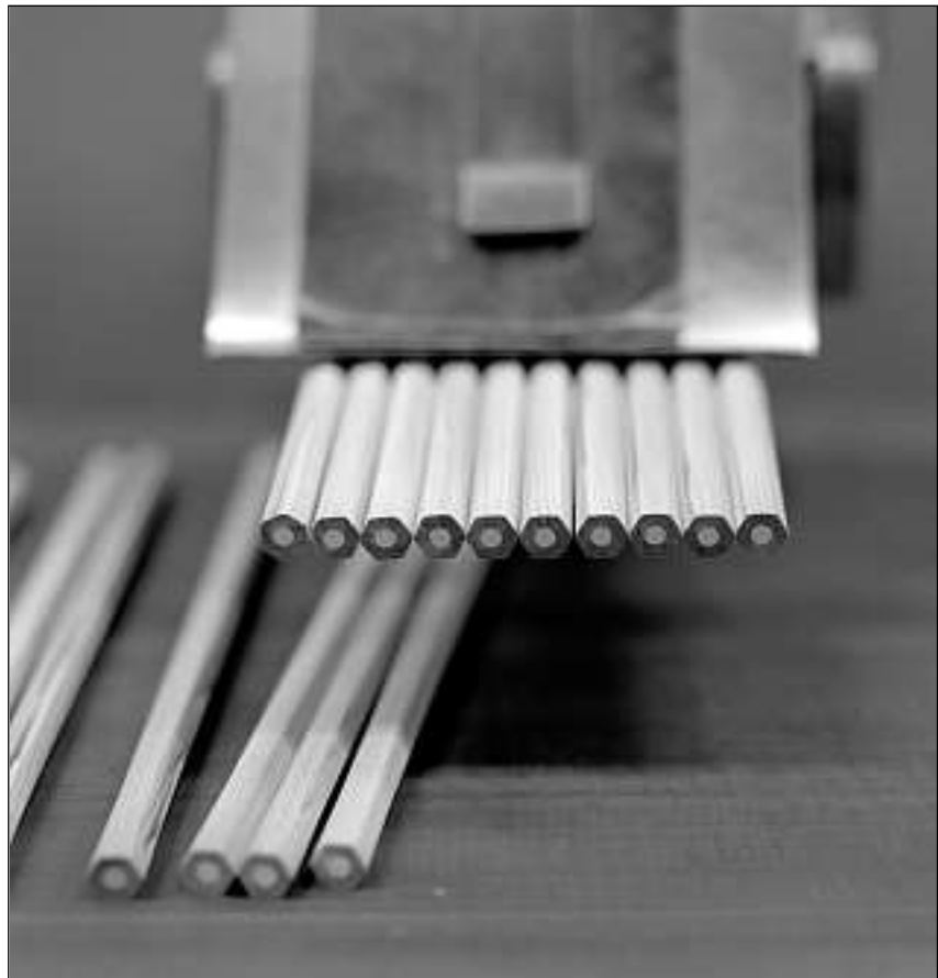
Sche la mina è precis amez il lain, è quai in segn da qualitat.