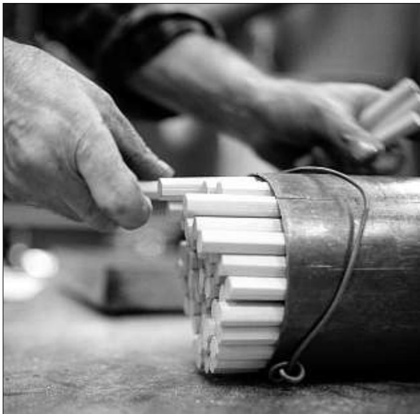
Lain da ceder vegn duvrà per far rispials. Durant la segunda guerra mundiala han ins era duvrà schember dal Vallais e dal Grischun.

Jau ma sun dal reminent infurmà tar il Dicziunari Rumantsch Grischun (DRG) danunder ch'il pled «rispli» vegnia. El deriva dal dialect tudestg «Riss-Bli». La silba «-bli» munta «Blei», perquai ch'jau consisteva antruras da plum. La silba «Riss-» vul dir «reissen». Pli baud duvravan ins «reissen» per skizzar u disegnar. En il pled «Reissbrett» ha questa muntada da «reissen» survivì fin oz.