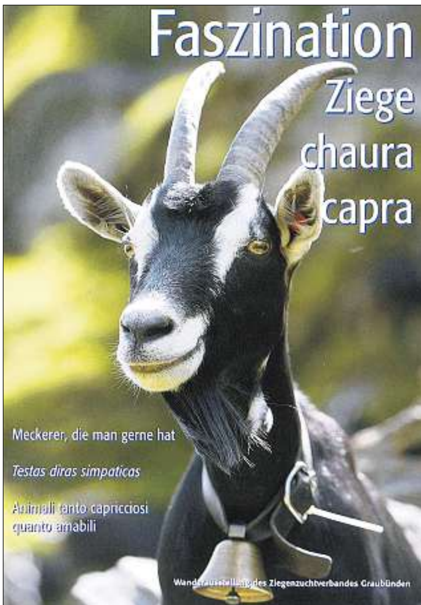
Cuverta da la brochura „Fascinaziun chaura“

Pli baud pasculavan muntaneras da chauras savens er en guauds e chaglias. Cun rusignar vi da las scorsas da planti-