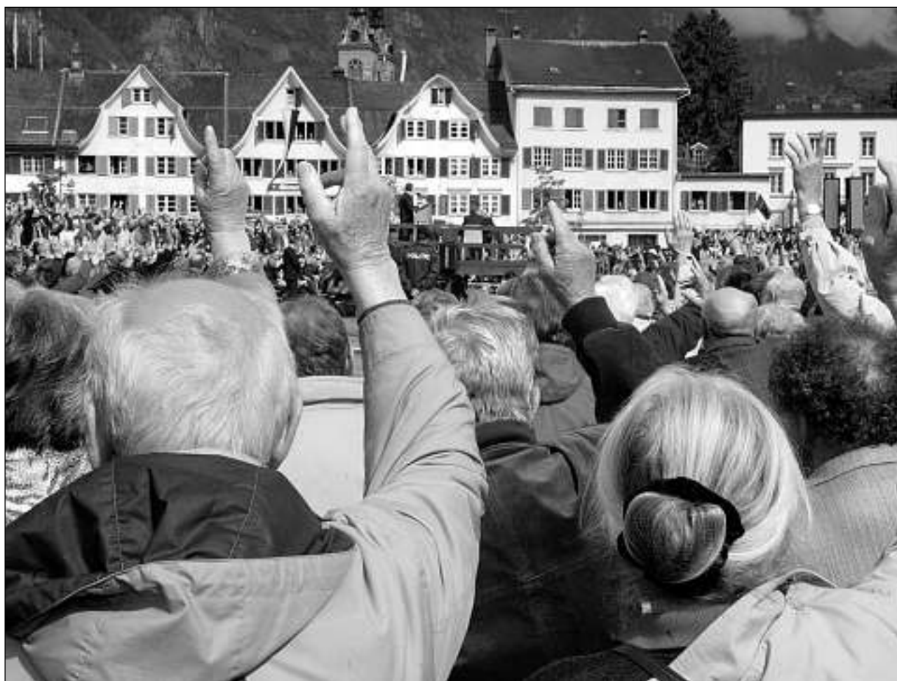
Il cumin da Glaruna ha decedì da reducir il dumber da vischnancas en il chantun.

La regenza prenda cleramain posiziun per il model da trais vischnancas, malgrà ch'ella era sa fatga ferma il 2006 per il model da diesch vischnancas. En sia posiziun scriva la regenza ch'ella saja la «fiduziaria» dal cumin, e perquai obligada da realisar las decisiuns ch'il pievel dettia sura.