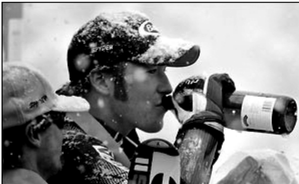
Bode Miller ha said

En moda cronologica descriva Bode sia via, davent da chasa a la scola da sport, en il team naziunal da skis. Quai era ina via cun grondas curvas, ma che al ha manà la finfinala sin ils podests. Bode Miller n'è betg in uman che