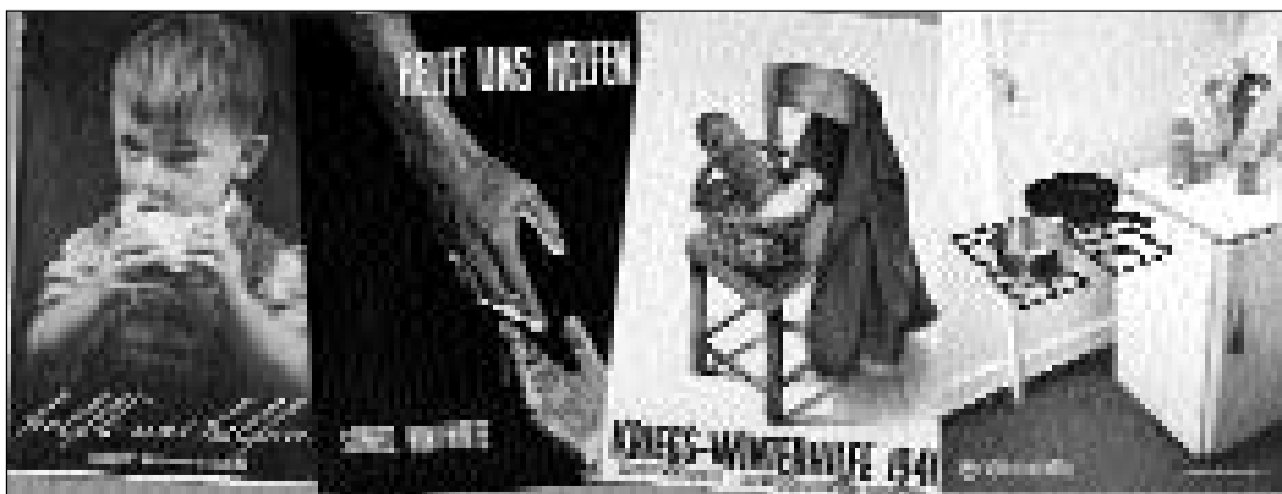
Art da placats cun l'ir dal temp: Ils placats dal succurs d'enviern dals onns 1938, 1939 e 1940 ed il placat actual, creà da Régis Golay, école cantonale d'art de Lausanne.

Conto da donaziuns dal Succurs svizzer d'enviern: Conto postal 80-8955-1