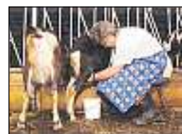
Muntaneras en ils vitgs - oz ina raritad