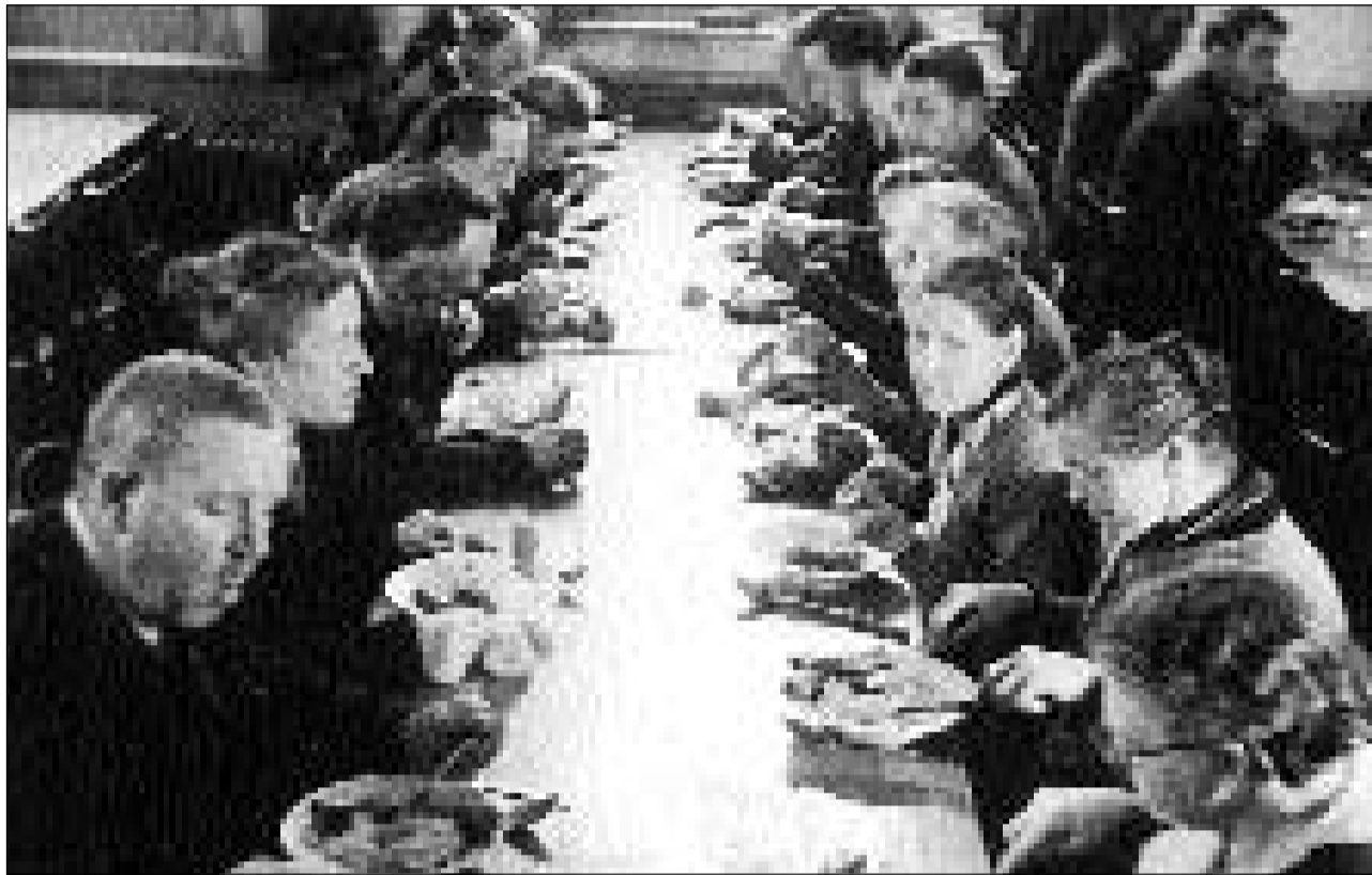
Ils onns trenta e quaranta ha il succurs d'enviern fundà e sustegnì dapertut cuschinas da schuppa.

La paja ad onn per ina famiglia cun tschintg u plirs uffants era ils onns 1936 fin 1945 tranter 1500 e 2000 francs. En modestia e spargnusadad remartgabla vivevan quellas famiglias per part en relaziuns miserablas per na stuaire retrain dal sustegn dals povers (oz Uffizi dal servetsch social); da far quel pass era per els il pli grev e degradant. Sch'il gudogn dal bab mancava ed ins n'aveva nagins respargns, porscheva il succurs d'enviern sustegn: Material da stgaur (charvun, laina, ieli) era in grond import, medemamain vestgadira d'enviern e stivals. Perquai che durant quest temp pativan plitost ils abi-