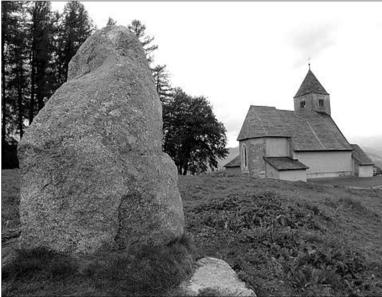
Falera cun ses megalits stat per la remartgbla savida astronomica rimnada en la Foppa en il temp da bronz.