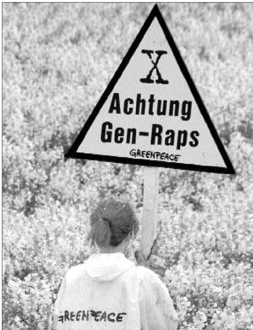
En la debatta davart la tecnologia da gens vai per chattar in cumpromiss tranter in scumond general ed ina libertad assoluta.

La finamira da la lescha è la protecciun da l'uman e da l'ambient cunter la pe-